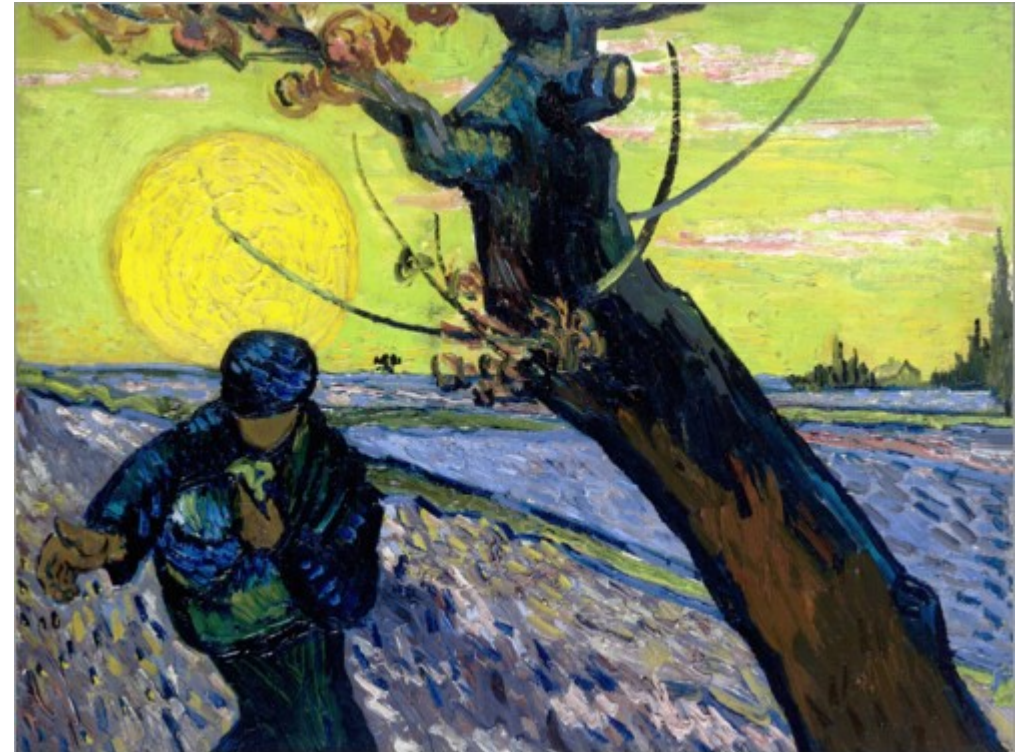
Såmannen av Vincent van Gogh

Det er gudstjeneste i Søsterhjemmet kl 11 denne søndagen. Kapellet er åpent hver dag for lystenning og en stille stund.